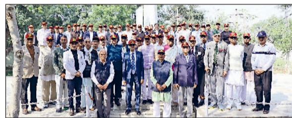
कोसली। शहीद स्मारक पर मौजूद क्षेत्र के पूर्व सैनिक।

कोसली गांव व क्षेत्र के सैकड़ों पूर्व सैनिकों व आम नागरिकों ने रेजांगला दिवस पर कोसली स्थित शहीद पर स्मारक पर पहुंचकर रेजांगला में बलिदान हुए वीरों को श्रद्धांजलि दी। कोसली में पहली बार रेजांगला दिवस मनाने की परंपरा की शुरुआत की गई। कोसली क्षेत्र का इतिहास वीरता, बलिदान व शौर्य की गाथाओं से भरा हुआ है इसीलिए इसे