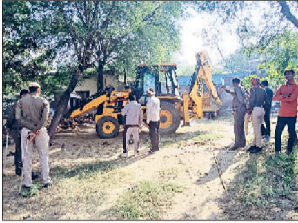
बावल। सांजरपुर में अतिक्रमण साफ करती प्रशासन की जेसीबी मशीन।