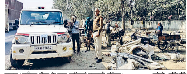
बावल। बनीपुर चौक के पास झुगियां हटवाती पुलिस।

नोटिस के बाद पुलिस ने हटवाया अतिक्रमण आपराधिक किस्म के लोगों के आश्रय स्थल साबित हो रही थीं झुगियां