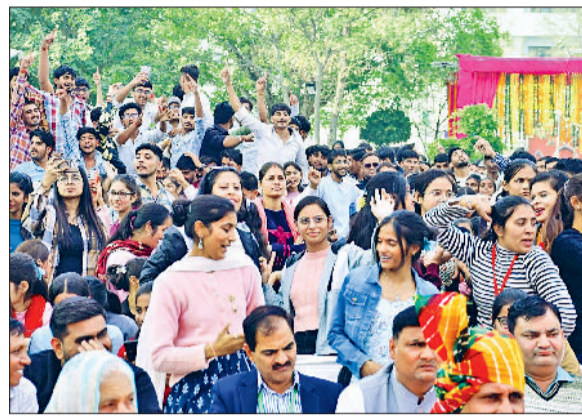
मीरपुर। हिंडोला में अपनी प्रस्तुतियां देते हुए कलाकार व महोत्सव का आनंद उठाते हुए विद्यार्थी।