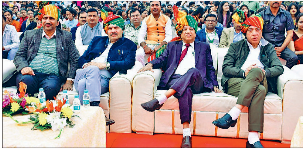
मीरपुर। कार्यक्रम में मौजूद चीफ गेस्ट व अन्य।

हरियाणावी संस्कृति के संगीतों से युवा महोत्सव में उपस्थित सभी विद्यार्थियों, अतिथियों और दर्शकों को आनंदित किया फोक/ट्राइबल डांस, रैप वॉक मेल, रैप वॉक फीमेल प्रतिस्पर्धाओं का आयोजन किया गया। स्टेज नंबर 2 पर कव्वाली, रिचुअल्स, माइम एवं स्टेज नंबर तीन पर क्लासिकल डांस, लाइव स्वर इंडियन, ग्रुप सोंग इंडियन, स्टेज नंबर 4 पर हरियाणावी फोक सोंगा सोलो, पोएटिक इंग्लिश, पोएटिक हिंदी, स्टेज नंबर 5 पर क्विज (ग्री), डिबेट हिंदी, डिबेट अंग्रेजी, क्विज (मैस) एवं स्टेज नंबर 6 पर कोलाज, पोस्टर मेकिंग, रंगोली प्रतिस्पर्धाओं का आयोजन किया गया। नशा मुक्त भारत अभियान के अंतर्गत सभी विद्यार्थियों, शिक्षकों एवं कर्मचारियों को नशा न करने की प्रति जागरूक करते हुए शपथ दिलाई गई।