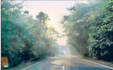
रेवाड़ी। मंगलवार सुबह सड़क पर छाया धुआं, एक खेत में जमीन से बाहर आ रही गेहूं की फसल।

तापमान सामान्य से कम रहने के कारण इस बार नवंबर माह के शुरू में ही ठंड ने दस्तक दे दी थी। अब मौसम कड़ाके की ठंड की ओर बढ़ रहा है। माह के अंत तक पारा जमाव बिंदु के आसपास पहुंचने की संभावना है। एक्यूआई में कमी के बावजूद प्रदूषण का स्तर बढ़ा हुआ है, जिससे आसमान में धुआं साफ झलकता है। बुधवार को आसमान में आंशिक या घने बादल छाने की संभावना है। मंगलवार को सुबह से ही मौसम साफ रहने के कारण