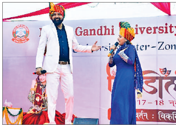
मीरपुर। हिंडोला में अपनी प्रस्तुतियां देते हुए कलाकार व महोत्सव का आनंद उठाते हुए विद्यार्थी।