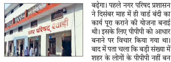
हूई है। ऐसे में समय पर नगर परिषद के चुनाव होने की कोई संभावना नहीं है। शहर की सरकार के लिए चुनाव लड़ने की तैयारी में जुटे लोगों को अभी लंबा इंतजार करना पड़ सकता है। आगामी जनवरी माह में नगर परिषद की सरकार का कार्यकाल पूरा हो जाएगा। शहर में मतदाताओं की संख्या बढ़ने के कारण अब एक वाई बढ़ना तय है। शहर में 31 की जगह 32 वाई बनाए जाने हैं। इनमें एक आरक्षित वाई

नगर परिषद का कार्यकाल हो जाएगा जनवरी में पूरा, नई वाई बंदी में देरी के कारण समय पर नहीं हो सकेंगे चुनाव