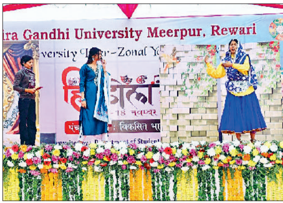
मीरपुर। हिंडोला में अपनी प्रस्तुतियां देते हुए कलाकार व महोत्सव का आनंद उठाते हुए विद्यार्थी।